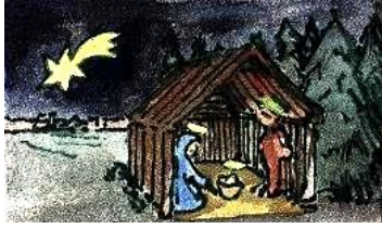
Un portal de Belén