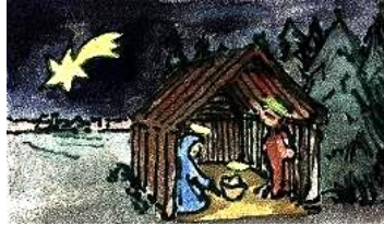
Un portal de Belén